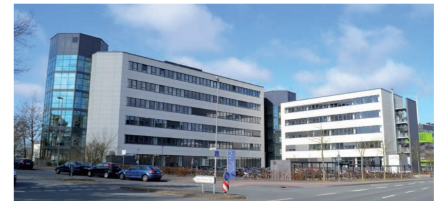
Fachhochschulzentrum der FH Münster

Der LL.M. ist ein international anerkannter aufbauender Abschluss für Juristen sowie für Berufstätige anderer Fachrichtungen, die in einem spezialisierten rechtlichen Bereich arbeiten möchten.