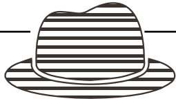
Grüner Hut „Der Kreative“