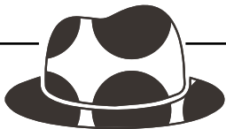
Gelber Hut „Der Optimist“