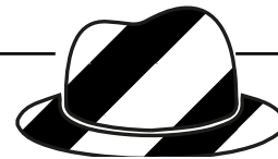
Blauer Hut „Die Überblickende“