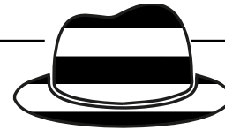
Schwarzer Hut „Der Kritische“