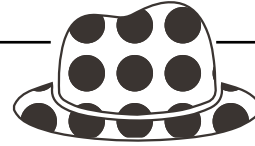
Roter Hut „Der Emotionale“