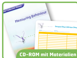
CD-ROM mit Materialien